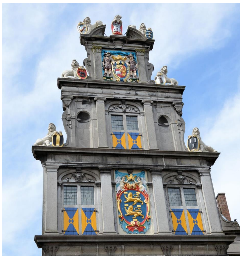
Het wapen van West-Friesland, centraal op de voorgevel van het voormalig Statencollege in Hoorn.

Vereniging Oud Hoorn en het Westfries Genootschap